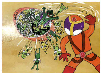
主役は正義の味方3ヒーロー: 救急、消防、救助の「スリーサンダー」(三田=サンダとかけている)。危険の象徴は悪役として登場する。